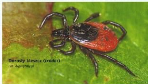
Dorosły kleszcz ( Ixodes )

Na ogół boreliozę diagnozuje się klinicznie, gdy obecnych jest kilka objawów.