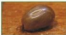
Samica kleszcza opita krwią

Nie trzeba także spędzać dużo czasu w lesie, by nabawić się tej choroby. Kleszcze obecnie żyją w parkach i przydomowych ogródkach. Przynoszą je również nasze psy i koty. Dorosła samica, którą przyniósł ze spaceru pies, może złożyć na naszym trawniku 2-5 tys. jaj.