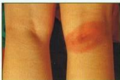
Rumień migrujący ( Erythema migrans ) powstały kilka tygodni po ugryzieniu kleszcza zakażonego krętkami Borrelia

Tylko niektórzy chorzy na boreliozę pamiętają ugryzienie. Aż 2/3 chorych na tę chorobę nigdy nie zauważyło kleszcza lub rumienia (czerwonej plamy pojawiającej się czasem w miejscu ugryzienia).